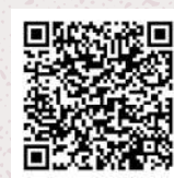
お申し込みフォーム